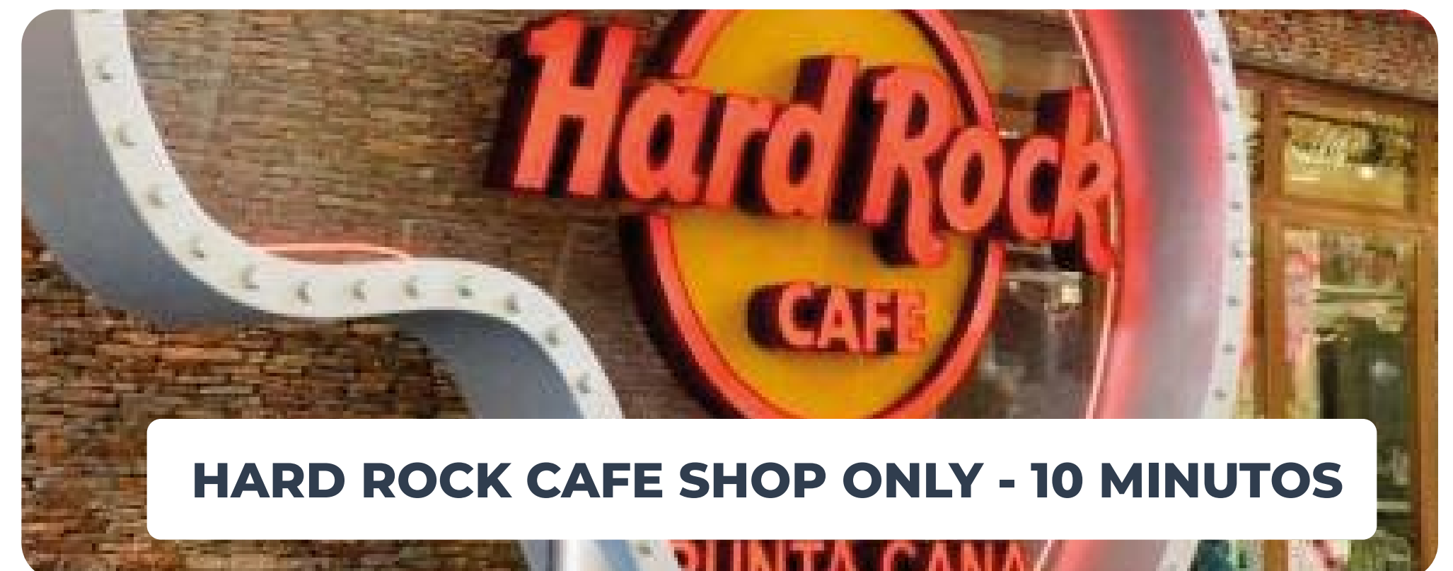
HARD ROCK CAFE SHOP ONLY - 10 MINUTOS