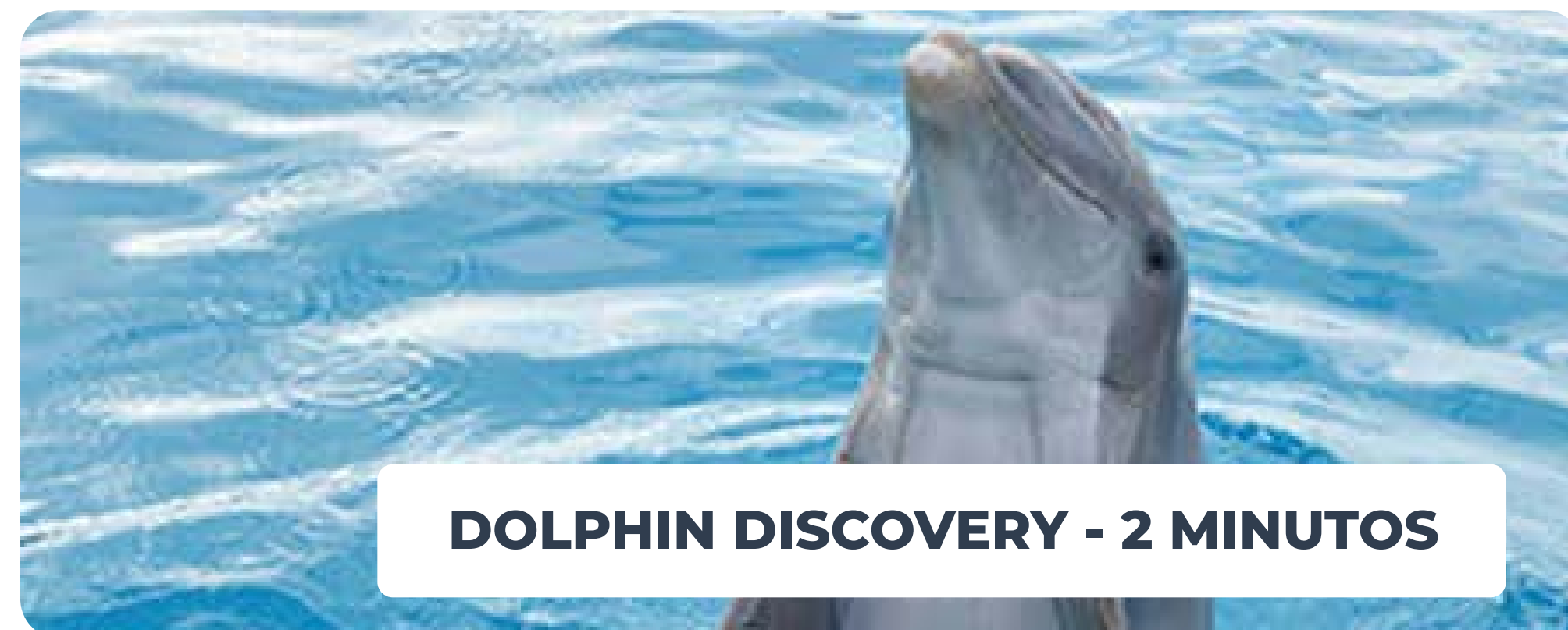
DOLPHIN DISCOVERY - 2 MINUTOS