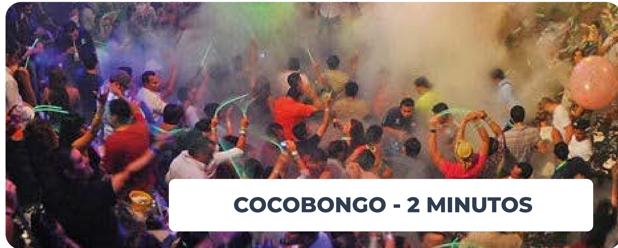
COCOBONGO - 2 MINUTOS