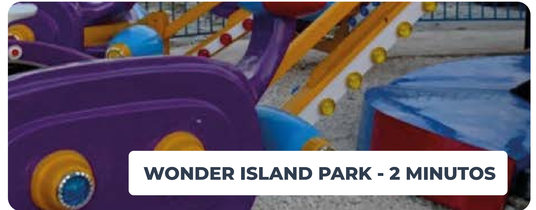
WONDER ISLAND PARK - 2 MINUTOS